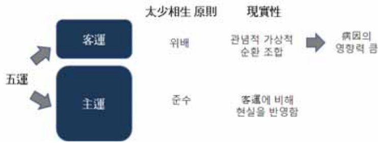
그림 4. 主運과 客運의 특성