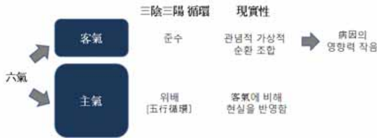
그림 5. 主氣와 客氣의 특성

그런데 三陰三陽의 가상적 循環 組合을 가지고 있는 客氣의 경우를 보면, 어느 하나 동일하게 循環하면서 세력이 강한 主氣 위에 客氣가 더해져서 미미한 변화를 일으키게 되는데 이것이 결과적으로 오히려 현실에서 많은 질병을 만들어내게 된다. 즉 현실에 영향을 미치는 六氣의 변화 속에서는 오히려 恒常性보다 미미한 변화를 일으키는 客氣의 순환이 질병을 일으키는 요소로 크게 작용하는 것이다. 12) 그러므로 『素問』 「六元正紀大論」에서 客氣 三陰三陽의 政을 설명하면서 다양한 질환과 대처 방법을 자세히 언급한 것은 바로 이 때문이다. 13) 그림 5에서 主氣와 客氣