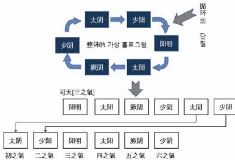
그림 1. 卯酉년의 客氣 循環 組合

쌀한 봄이 되는 것이지, 원래 太陽寒水의 성질이 겨울에 나타나는 것처럼 모든 자연환경이 얼어버리는 봄이 오지는 않는다. 그러나 의학적으로 본다면 이러한 미미한 변화의 차이가 우리 몸의 항상성을 파괴하고 면역성을 떨어뜨려 병을 일으키므로 病因의 관점에서 보면 主運, 主氣보다 客氣가 실제 영향력이 더 큰 것이다. 그림 2에서 이를 정리하였다.