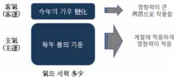
그림 2. 主客 運氣의 세력 多少와 영향력

三陰三陽의 循環은 시간의 변화에 따라 陰陽이 消長하는 것을 표현한 것으로서 생명체의 形質 변화와 氣의 변화를 함께 설명하는 모델이다. 일반적으로 陰陽은 단순히 상태의 多少를 말하는데, 3) 三陰三陽은