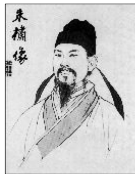
그림 1. 朱橚像

朱橚는 1361년 7월 1일 朱元璋의 다섯 번째 아들로 태어났다. 3) 아버지 朱元璋은 당시 34세로 元나라 末 紅巾族의 반란의 우두머리로 南京과 그 주변지역을 점령하고 있어 정치적으로 상당한 세력을 확보하고 있었다. 朱元璋은 朱橚이 8살에 되던 1368년 초 마침내 스스로 명의 황제임을 선포하고 난징을 수도로 정했다. 太祖가 그의 공식 諡號이나 통상적으로 洪武帝로 불린다. 4) 洪武帝는 20여명의 妃嬪을 두었으며 이들에게서 26명의 아들과 16명의 딸을 낳았다. 5), 6), 7) 그렇기 때문에 朱橚의 생모가 누구인지는 의견이 분분하다. 明史에 “皇第五子生, 孝慈皇后 8) 出也.” “太祖, 二十六子. 高皇后生太子標, 秦王棧, 晉王橚, 成祖, 周王橚.”라고 기록하고 있지만 9) 당시 후궁의 아들은 정실의 소생으로 입적되는 전통적 방식