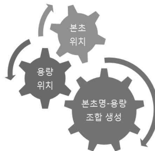
Fig. 1. fundamental of automatic extraction of compositional herb. 본초 조합의 자동 추출 원리

본 연구에서 사용한 본초-용량 추출 원리는 본초명과 용량에 해당하는 문자열의 위치 관계를 이용하여 본초의 용량 정보를 생성하는 것이다. 그 과정은 크게 3단계로 구분할 수 있다.