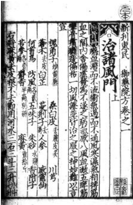
Fig 1. Eoyakwonbang: Seikado[靜嘉堂] Edition

살펴볼 수 없으나 卷20이 靜嘉堂本 마지막 卷20과 동일한 내용이 기재되어 있으므로 편제도 동일할 것으로 판단된다. 둘째, 처방명이 모두 陰刻으로 되어 있다. 셋째, 藥量을 표기하는 방법이 ‘一二三四~’ 형태 대신 ‘壹貳參肆~’의 형태로 표기된 것이 많이 있다.