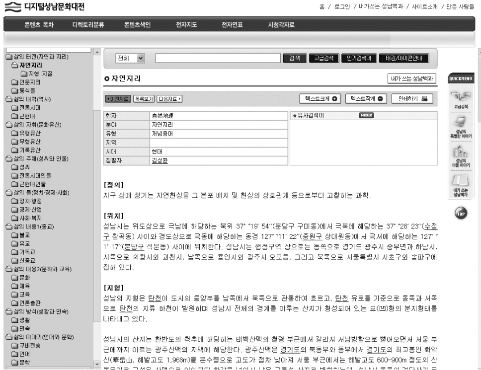
〈그림 4〉 '디지털성남문화대전'의 성남향토문화대백과의 중분류

연구기반을 확충한다. 둘째, 21세기 시·군지의 표준 프레임워크를 제시함으로써 종래 시군지 편찬 사업의 중복성과 비효율성 해소를 통해 공공예산을 절감할 수 있다. 셋째, 지역의 문화적인 특수성과 관련된 고급지식정보를 적시에 제공하여 지역특화산업발달에 기여한다. 넷째, 문화콘텐츠상품개발의 중간재역할을 한다. 다섯째, 인문지식과 정보기술을 아우르는 학제적 전문인력을 배양하려는 데 있다(한국학중앙연구원 2008).