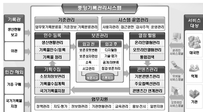
(자료: 국가기록원 2007 중앙기록기록관리시스템 구축사업완료 보고회 PT자료 p.6)