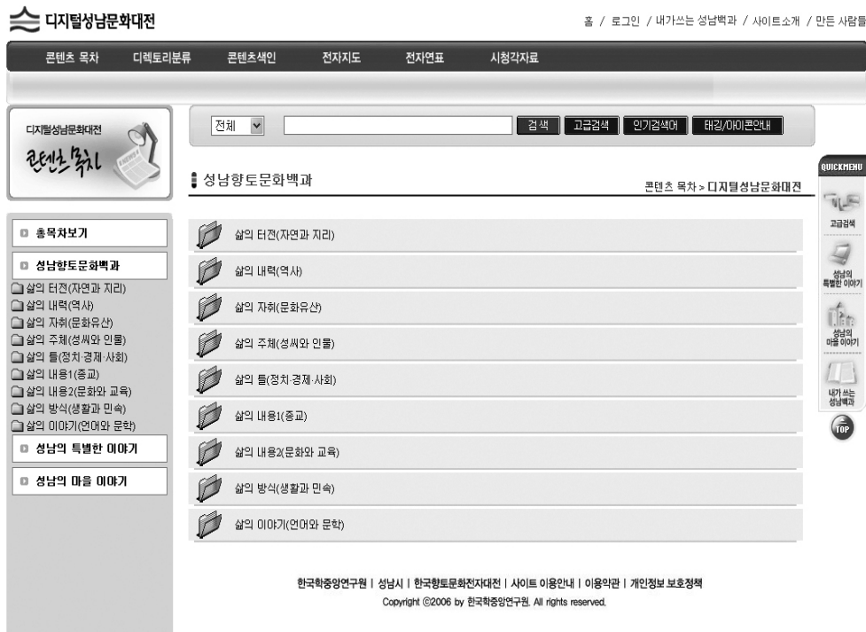
<그림 3> '디지털성남문화대전'의 성남향토문화대백과의 대분류

이 사업의 편찬이 갖는 의의는 첫째, 지역문화자료의 체계적인 발굴을 통해 한국문화 연구력 수준을 제고하고 디지털 시·군지 편찬의