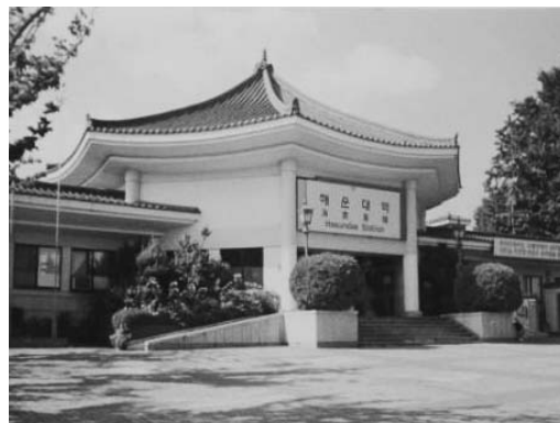
〈그림 1〉 해운대역의 구역사(舊驛舍)와 신역사(新驛舍) 전경 사진