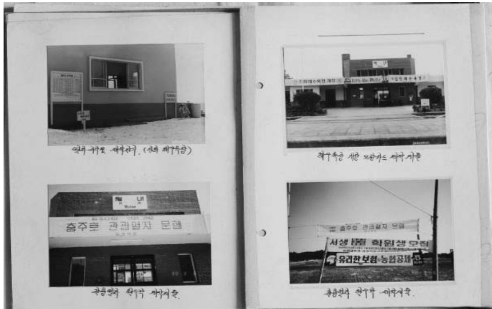
〈그림 4〉 월내역 표준역정비 사진첩