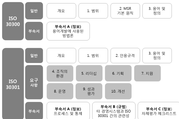
〈그림 3〉 MSR 30300 및 30301 세부구성(류가현 2011)

MSR의 원리는 “ISO 9000 – 품질경영시스템 – 기본사항 및 용어(ISO 9000:2005 Quality management system – Fundamentals and vocabulary)”에 수록된 품질경영 원리와 유사한데 그 내용으로는 고객중심, 리더십과 설명책