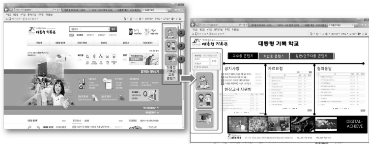
<기존 대통령기록관 누리집>