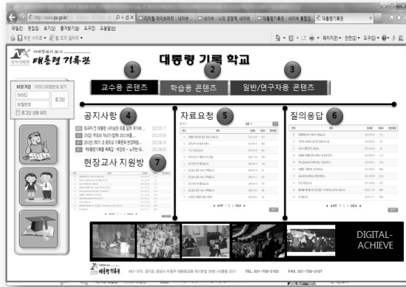
〈그림 4〉 대통령기록관 교육용 콘텐츠의 메뉴구조