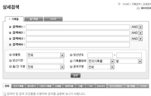
〈그림 3〉 국내 대통령기록관 웹사이트: 상세검색

별 키워드 검색이 가능하다. 제시된 기록 유형에는 전자기록물, 종이문서, 시청각기록물, 간행물, 행정박물, 선물, 기타, 온라인 콘텐츠, 웹기록물이 있으며 분류체계와 사이트를 대상으로 하는 검색도 가능하다. 상세검색에서는 키워드의 불리언 조합이 가능하며 다양한 검색 조건을 지정할 수 있다(〈그림 3〉 참조). 미국의 대통령 기록관에 비해 국내 대통령기록관에서는 발전된 형태의 키워드 검색기능을 제공하고 있음을 알 수 있다.