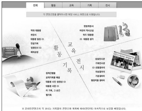
〈그림 4〉 국내 대통령기록관 웹사이트: 온라인 콘텐츠

련된 콘텐츠로는 활동과 기록 카테고리에 있는 자료들이라고 할 수 있다. 활동 카테고리에는 역대대통령 소개와 취임식, 연설기록, 대통령일정, 임명인사, 해외순방에 대한 기록들이 제공되고 있다. 연설기록은 연설문, 음성, 동영상의 형태로 제공하며 연설기록에 대한 상세검색이 가능하다. 대통령일정은 초대대통령 재임 시기인 1948년부터 월별 또는 연대순으로 볼 수 있게 제공하고 있다.