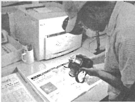
<그림 3> 이미지 촬영

사진의 서지 레코드에 해당하는 사진이미지를 확인하고 링크하기 위하여 이미지파일을 인쇄하고<그림 5> 참조), 원본으로서의 tif파일은 CD-ROM을 이용하여 Backup파일을 만들어 둔다.<그림 6> 참조)