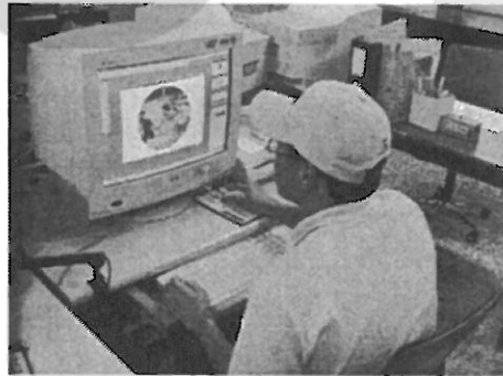
<그림 4> 이미지 편집