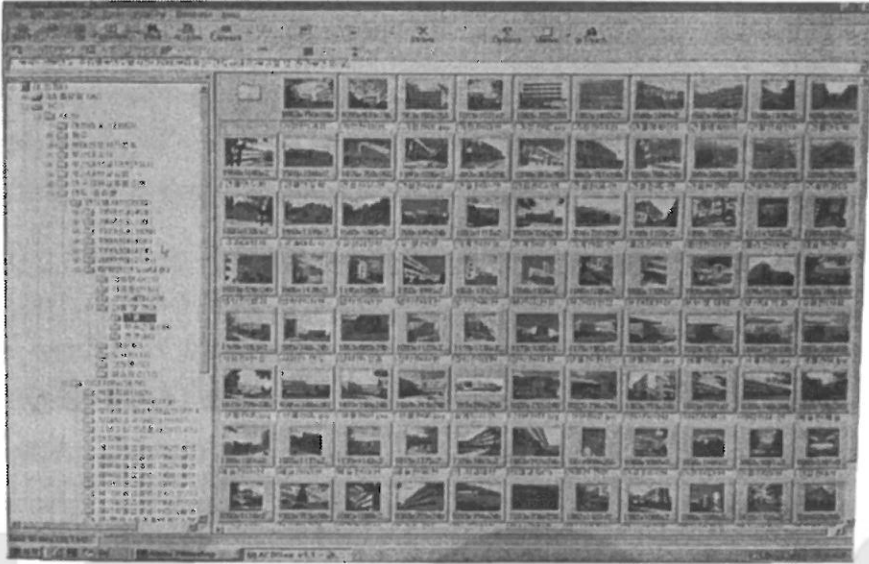
<그림 1> PC에서의 사진 이미지파일 관리