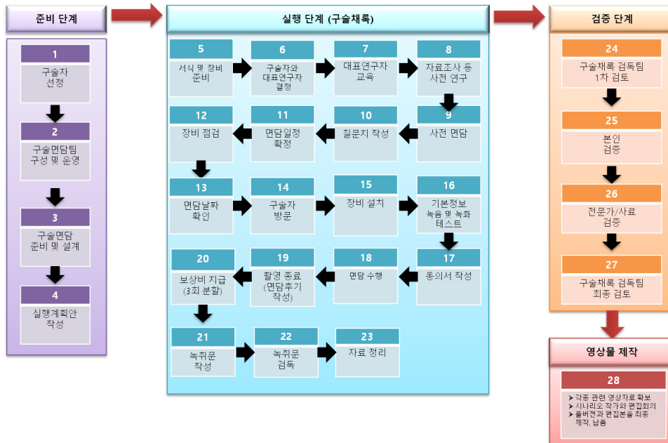
〈그림 3〉 구술채록 진행 절차