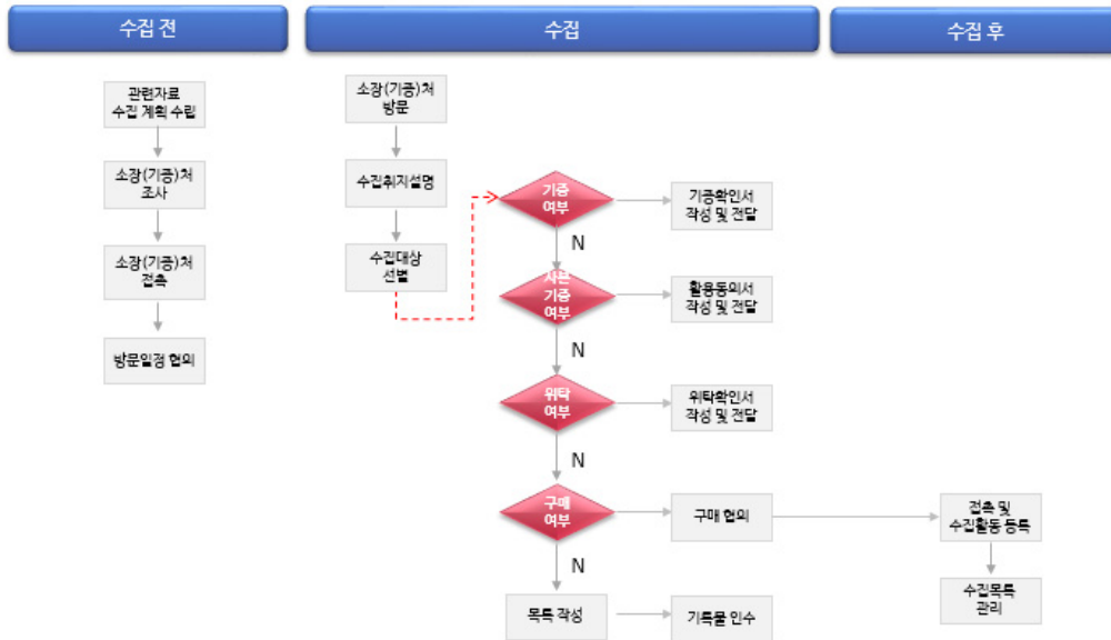
〈그림 2〉 ‘한국야구 명예의전당’ 관련 기록물 수집 절차

개인 기록물 수집뿐만 아니라 그들에게서 그 당시 기억과 지식을 담아낼 수 있는 구술채록 자료 또한 중요한 기록물로서 활용할 수 있는데 국내에서는 1990년을 전후로 역사학, 인류학, 사회학 등과 관련된 연구기관과 정부산하 기관을 중심으로 특정 사건 혹은 계층을 대상으로 구술채록이 시작되었다. 국내 기관 가운데 지속적으로 구술채록 사업을 통해 다양한 자료와 기록물의 정리에 대한 논의가 진행 중인 국사편찬위원회와 체육 기관으로서 구술채록을 선행한 대한체육회의 사례를 살펴본다.