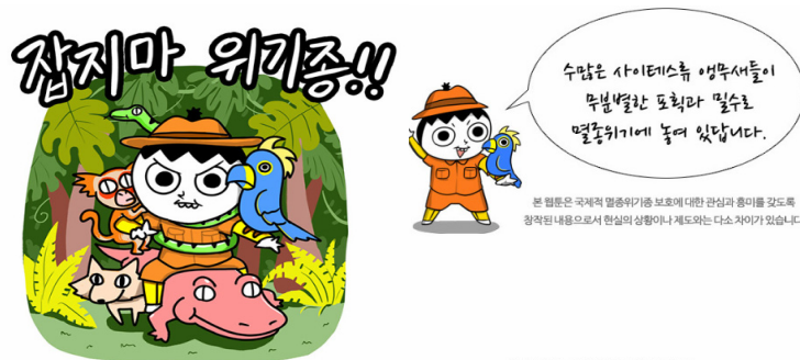
<그림 5> 환경부 브랜드웹툰 '잡지마 위기종!'

<그림 6>은 한국원자력문화재단의 브랜드웹툰으로 원자력으로 움직이는 인공지능 인형 아곰이를 통해 한국원자력문화재단과 원자력에 대한 인식의 변화를 꾀한 브랜드웹툰이다. 2016년