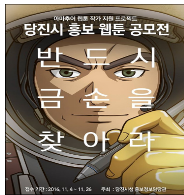
<그림 2> 당진시 홍보 웹툰 및 공모전 포스터