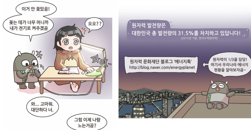
〈그림 6〉 한국원자력문화재단 브랜드웹툰 ‘아고믹라이프’

10월 14일부터 연재되었으며 첫 회에 천 개 이상의 댓글이 달리고 1만 명이 넘는 독자가 별점을 등록하였다. 원자력에 대한 불안과 부정적인 인식이 만연해 있기 때문에 이를 개선하기 위하여 브랜드웹툰을 활용하였으며, 이를 통해 기관 및 원자력에 대한 긍정적인 이미지를 심어주고 원자력의 활용성을 자연스럽게 표현하고 있다.