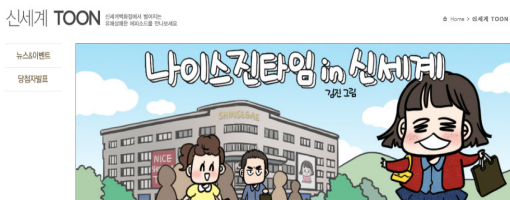
<그림 3> 신세계 브랜드웹툰 출처: 신세계 < https://www.shinsegae.com/weekly/toon_list.jsp >