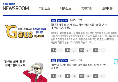
<그림 4> 삼성전자 브랜드웹툰