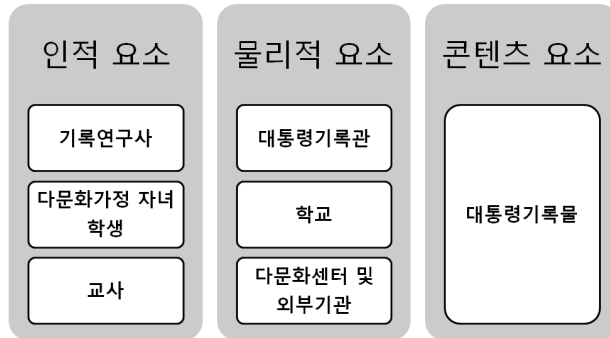
<그림 1> 제안 교육프로그램 구성요소 관계

인적요소는 본 연구에서 제안하고자 하는 프로그램에 참여하는 모든 사람으로 구성되고 크게 이용자이자 학습자인 다문화가정 자녀, 기록물 및 콘텐츠를 개발하여 제공하는 기록연구사, 교육 프로그램을 진행하는 교사로 구성된다. 이용자는 피부색, 언어발달의 지체, 경제적 편견 등으로 인한 이유로 인하여 정체성 형성의 결여로 자아존중감에 많은 어려움을 겪고