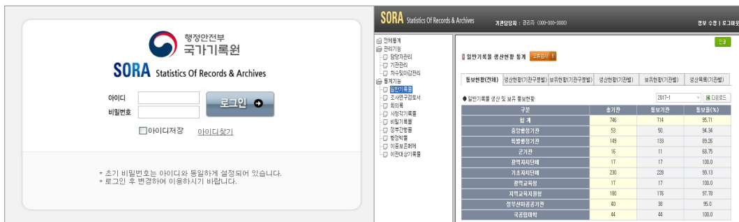
〈그림 1〉 생산현황통보시스템(SORA) 화면

기록물 관리지침은 생산현황 통보를 시스템 유형에 따른 전자통보와 15개 서식의 수기통보 방식으로 구분하여 제시한다. 하지만 전자통보 방식에 많은 지면을 할애하고 있음에도 불구하고 서식뿐만 아니라 전자통보 파일까지 SORA를 통해 최종 제출하도록 하고 있다. SORA는 통보현황을 제출받는 취합 프로그램이며 기록생산시스템이나 기록관리시스템과 연동하여 데이터를 전송·교환하는 기능은 없다. 따라서 SORA를 통한 생산현황의 제출은 전자통보가 아닌 수기통보 방식으로 보아야 한다. 모든 현황을 SORA로 제출받는 현재의 생산현황 통보