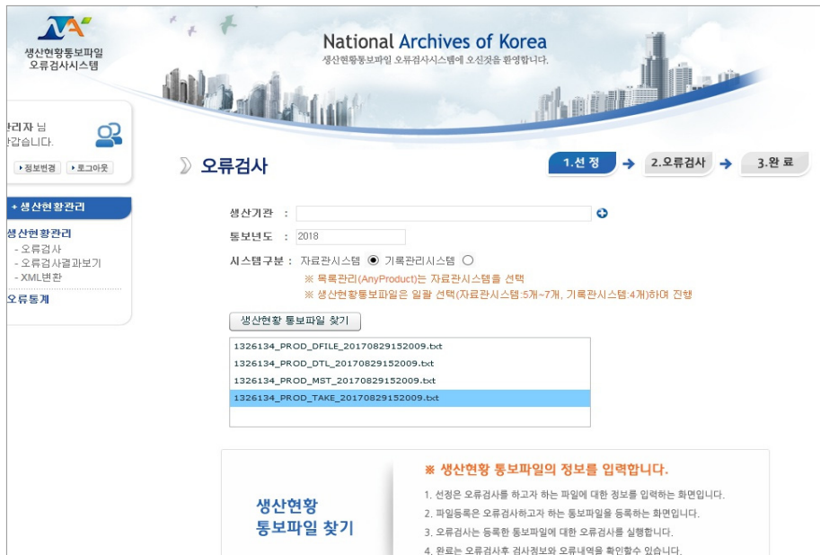
<그림 2> 생산현황통보 오류검사 프로그램 화면

실무 수행 과정에서 확인되는 오류 유형들은 대체로 전송오류 또는 통보파일의 규격오류들이다. 전송오류는 오류검사 프로그램으로 통보파일을 전송하는 과정에서 주로 발생되며 그 원인은 대체로 통보파일의 용량과 관련되어 있다. <그림 3>은 실제 제출된 기관의 통보파일의 용량을 확인할 수 있는 화면이다.