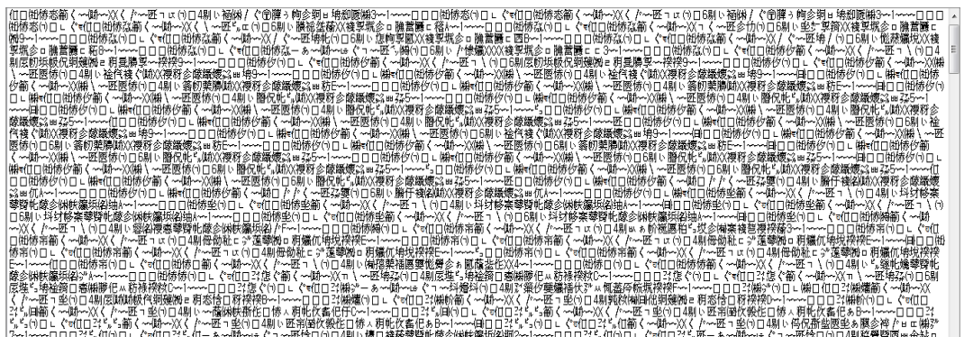
<그림 6> TXT 형식 통보파일의 비가독성

<표 11>을 보면 각 요소들의 기본키 값을 사전에 정한 형식에 맞춰 숫자를 입력하는 방식임을 알 수 있다. 만약 01-06 사이의 범위를 벗어난 값이 잘못 기재되면 오류가 발생하게 되는 것이다. 하지만 사전 정의 값의 형식이 복잡하다면 사람이 이해하고 수정하기란 사실상 불가능해질 것이다. 다음은 단위과제코드 값의 예시이다.