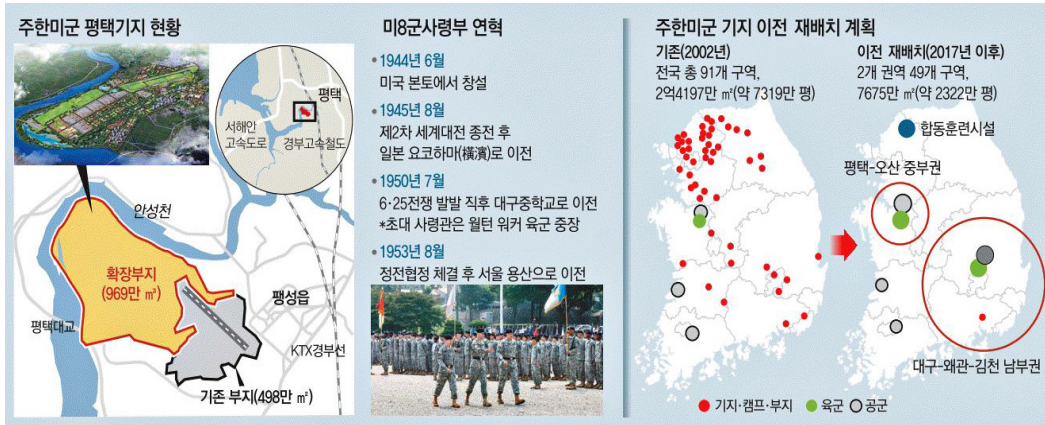
〈그림 1〉 주한미군 기지 이전 재배치 계획 1)