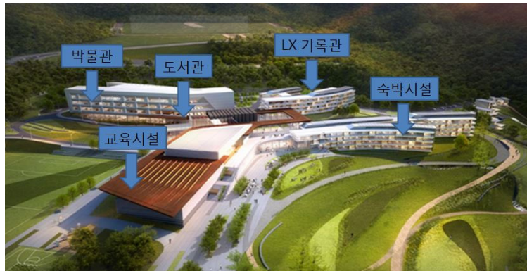
〈그림 1〉 국토정보교육원 내 LX 라키비움 조감도