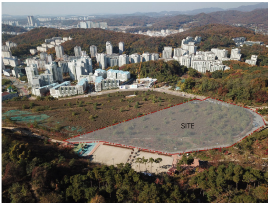
〈그림 3〉 국립한국문학관 설립 부지 전경

지원은 물론 문학인 및 문학 향유자를 위한 지원 역시 확대될 것이라는 기대가 모아졌다. 문학진흥계획의 정책적 추진을 위하여 문체부는 우선적으로 국립한국문학관 설립을 추진하였다. 문학진흥법 제18조에 의하면, 문화체육관광부 장관은 국가를 대표하는 문학관으로 국립한국문학관을 설립해야하며, 국립한국문학관은 법인으로 하되 문화체육관광부 장관이 관장을 임명하게 된다. 이에 2022년 개관을 목표로 하여 2018년 11월에는 ‘국립한국문학관 설립추진위원회’에 의해 ‘은평구(은평뉴타운 3-13BL 및 기차촌 근린공원 일원/ 19,800㎡)’로 설립 부지가 확정되었다.