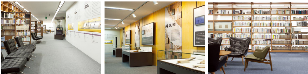
〈그림 1〉 근대문학 라키비움: 개실 당시 모습

국립한국문학관 건립은 1996년이 ‘문학의 해’로 지정됨과 함께 문학계에서 한국문학 자료를 집대성 할 기관의 필요성이 제기되면서 그 논의가 시작되었다. 이후 여러 부침을 겪다가 2015년 국립한국문학관 건립의 전초기지로서 ‘근대문학정보센터’가 국립중앙도서관 내에 설치되었다. 근대문학정보센터는 개소 이듬해인 2016년 3월 본관 2층에 위치한 문학실을 ‘근대문학 라키비움(Larchivium)’이라는 복합 문화공간으로 재단장하여 이용자들에게 공개하였다. 기존 도서관 자료실의 주 기능이었던 문학 장서 열람에 더하여, 한국 근대문학 자료를 대상으로 상설전시와 특별전시를 설치·운영하였다. 이 공간에 들어선 이용자들은 한국인이 사랑하는 시인 백석의 초상화와 100부 한정본 희귀 시집인 『시슴』을 비롯하여, 최초의 신소설 『혈의 누』부터 윤동주의 유고시집 『하늘과 바람과 별과 시』까지 흔히 교과서에서나 접할 수 있었던 한국문학사의 중요한 작품들의 초판본을 직접 눈으로 확인할 수 있었다. 이와 함께 근대문학 디지털 원문을 검색할 수 있는 것은 물론, 근대문학 연구서 등 별도의 참고도서 서가를 만들어 이용자들은 전시를 관람하면서 문학책을 읽고, 전문적인 연구 정보까지 얻을 수 있었다.