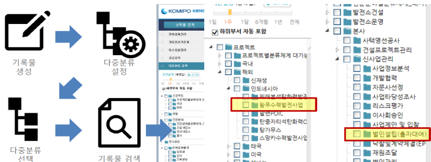
〈그림 2〉 다중분류체계 활용 현황

또한, 기능분류체계와 별도로 기관의 특성을 고려하여 다중분류체계를 사용할 수 있도록 설계하였다. 한국중부발전은 발전소 건설 및 운영, 사업개발 등에 관한 업무를 수행하기 때문에, 프로젝트별, 전문분야별로 업무담당자들이 원하는 분류의 활용에 대해 요구가 많았으며, 이러한 다중분류는 지식 관리 등에 활용될 예정이다.