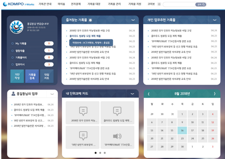
〈그림 4〉 시스템 UI/UX