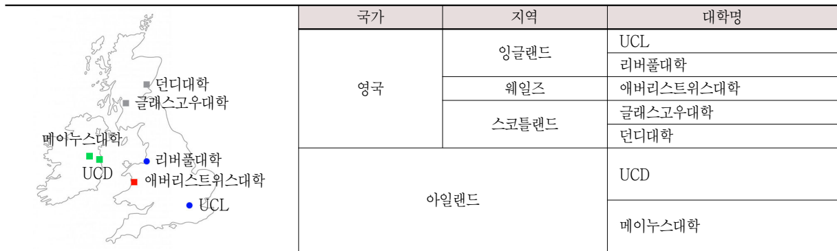
<표 3> ARA 인증 대학의 지리적 분포

ARA의 인증을 받은 7개 교육과정은 모두 대학원 과정이다. 이중, 우리나라 문헌정보학과에 해당하는 정보학과가 2곳, 역사학과가 2곳, 인문학과, 기록학센터, 기록학·정보학센터가 각각 1곳이다. 모든 교육과정은 석사학위가 기본이나, UCL, 리버풀대학, 글래스고우대학은 PgDip 또는 PgCert 학위도 제공하고 있다. 또한, 모든 교육과정이 1년 간의 집합교육을 기본으로 하고 있지만, 애버리스트위스대학과 던디대학은 원격교육과정을 함께 운영하고 있다(<표 4> 참조).