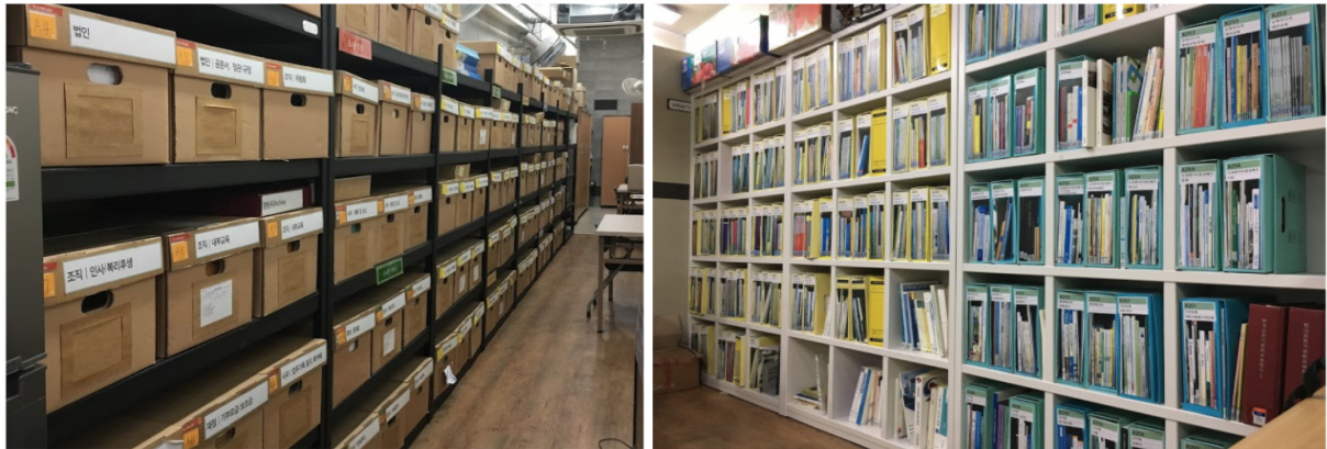
〈그림 1〉 기록보관실 아카이빙박스과 도서관계·커뮤니티 코너

이런 이유로 별도의 서가와 전시공간을 마련해두고 아카이브 자료 일부를 전시하고 있다. 그러나 이용자의 눈길을 끌 수 있는 지속적 관심과 관리가 필요한 상태이다. 마을에서 일어나고 있는 행사 등과 연계하고 마을 커뮤니티와 함께 전시를 기획한다면 보다 효과적으로 알릴 수 있는 기회가 될 것이다.