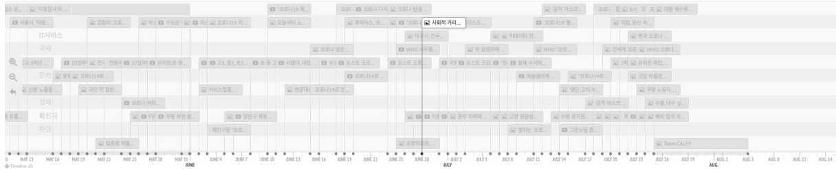
〈그림 3〉 코로나19 타임라인: 주제별로 선정한 핵심 이벤트를 시간에 따라 보여주는 기능