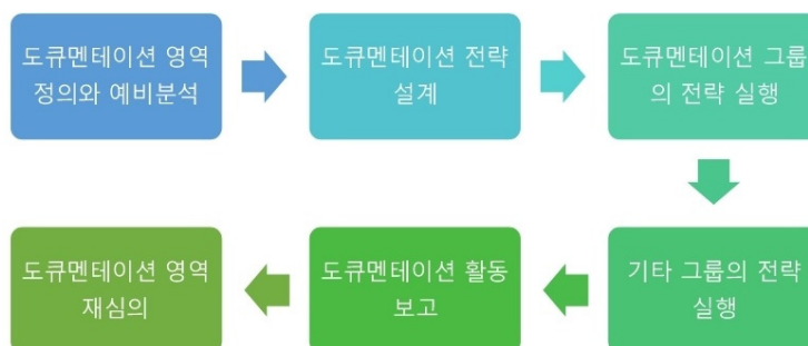
<그림 1> 헤크만의 도큐멘테이션 전략 모델

헤크만의 전략 모델은 1) 도큐멘테이션 영역 정의와 예비 분석, 2) 도큐멘테이션 전략 설계, 3) 도큐멘테이션 그룹의 전략 실행, 4) 기타 그룹의 전략 실행, 5) 도큐멘테이션 보고, 6) 도큐멘테이션 영역 재심 등의 6단계로 구성된다. 단계별로 주요 내용을 살펴보면 다음 <그림 1>과 같다.