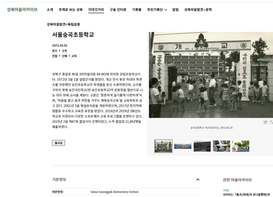
〈그림 3〉 성북마을아카이브 이야기거리(송곡초등학교)

2022년 2월 1일 현재 성북마을아카이브의 이야기거리는 1771건의 항목이 있으며 이는 크게 이야기, 시대, 지역, 문화재지정이란 기준으로 분류돼 있다. 이야기는 다시 사건, 인물, 장소, 유물, 문헌, 작품, 뉴미디어로 세분화 된다. 시대는 선사시대, 삼국시대, 고려시대, 조선시대, 일제강점기, 현대로 세분된다. 그리고 지역은 관내 동별로, 문화재지정은 지정 유형에 따라 나뉘져 있다. 한편 기록물 카테고리에서는 2022년 2월 1일 현재 9212건의 자료가 구축되어 있다. 이는 성북구와 관련된 사진, 영상, 간행물 등이 탑재되어 있다. 분류체계는 유형(시청각기록물, 일반기록물)과 생산(출판, 게시, 기고, 기증, 수집, 생산), 시대, 지역으로 구성된다. 이와 같은 자료의 분류체계 만들기는 성북마을아카이브 사업의 가장 어려운 점이었는데, 이는 성북구의 역사문화자원, 다시 말해 리소스의 특징을 파악하고 그에 알맞은 맞춤형 체계를 만들어야 했기 때문이다.