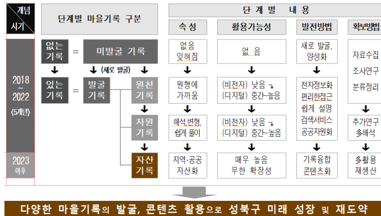
〈그림 2〉 마을기록: 단계별 개념 구분 및 발전 흐름도