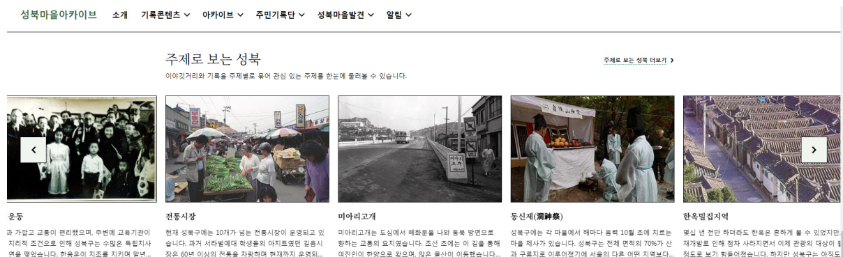
<그림 6> 주제로 보는 성북

성북마을아카이브는 박물관 시스템과 매우 유사하다. 관리시스템은 디지털 아카이브의 수장고이고, 이야기거리와 기록물은 상설전시, '주제로 보는 성북'은 특별전시라고 할 수 있다. 이외에도 마을아카이브팀은 2020년 3월부터 매주 금요일마다 문화원 블로그와 페이스북을 통해 그 달과 관련이 있는 마을 이야기를 짚막하게 소개하고 있다. '금요일마다 돌아오는 성북 이야기' 바로 '금도끼'이다. 이 콘텐츠는 2022년부터 고도화사업의 일환으로 홈페이지에 탑재될 예정이다. 이러한 지속적인 연구성과는 새로운 기록물을 찾거나, 새로운 큐레이션 주제를 탐색하는 과정으로 그 중요성이 크다고 할 수 있다.