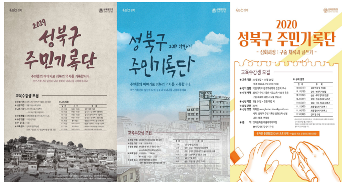
<그림 5> 성북구 주민기록단 포스터