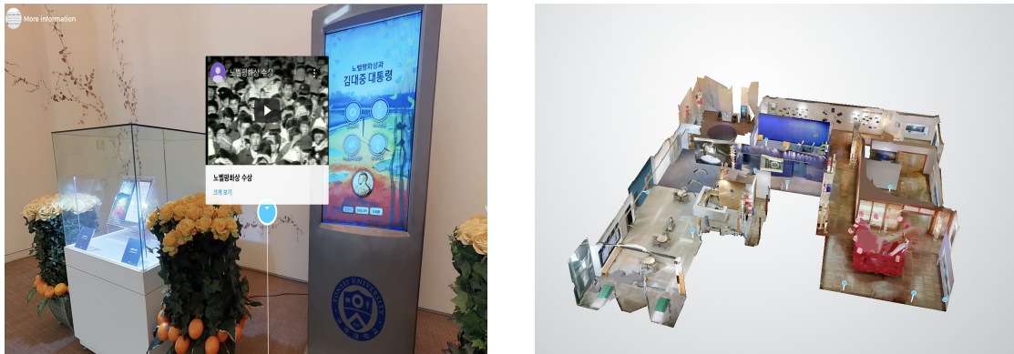
〈그림 3〉 김대중도서관 온라인 전시관

코로나 시대가 도래하면서 전시 관람에 대한 규제가 있었기에 2019년부터 전시를 예약제로 운영하였고 정보의 확장성과 이용자의 관심을 높이기 위하여 온라인 전시를 진행하고 있다. 온라인 전시는 접근성과 경제성 측면에서 이용자 만족도가 높은 서비스이다. 도서관에서 제공하고 있는 온라인 전시는 공간 정보를 주로 제공하는 Panorama VR 형식으로 구축되었으며 특정 위치에서 기록물 관련 영상이나 해제를 제공하고 있다.