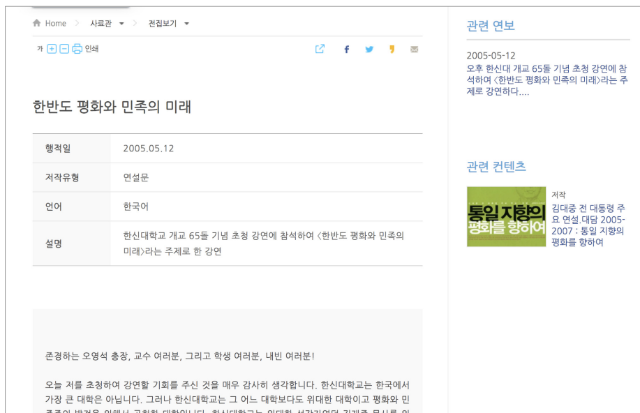
〈그림 2〉 김대중 전집 콘텐츠

2019년 김대중도서관은 김대중 대통령 전 생애에 대한 김대중 전집 작업을 완료하였고 2022년 8월 총 3,265건, 17,500페이지에 달하는 김대중 전집의 원문을 홈페이지에 공개하였다. 전집 콘텐츠는 기록물 정보, 기록물 원문 텍스트, 동일 등록본(동일 내용으로 다른 언어로 작성된 기록물), 관련 연보(해당 일자 연보 행적 링크 연결), 관련 콘텐츠 추천으로 구성된다. 1건 당 최대 32개의 메타데이터를 생성하였으며 이를 통해 이용자는 시대, 언어, 저작 유형 등 다양한 검색 포인트를 이용할 수 있고 관련 기록물과 정보를 확인할 수 있다. 홈페이지 속 전집 콘텐츠를 통해 원문 텍스트를 확인한 후 기록물에 대한 추가적인 정보나 연구 지원 서비스가 필요한 경우 기록물 정보에 기재된 등록번호를 도서관에 요청하면 내부 프로세스를 거친 후 기록물의 디지털 파일을 제공 받거나 서비스를 지원받을 수 있다.