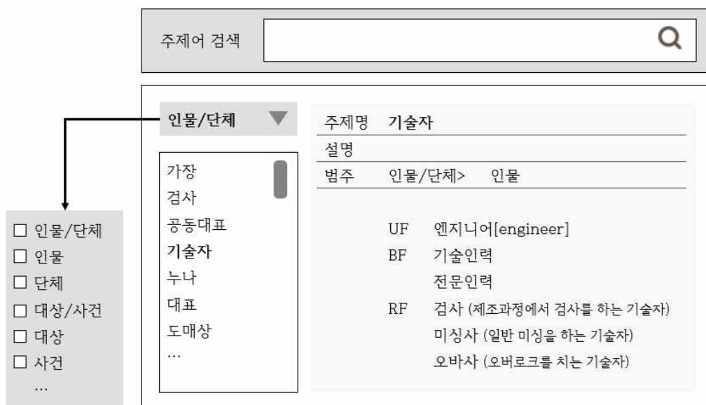
<그림 6> 주제명표목 기반 검색 화면(예시)

지금까지 해방촌 닷넷 사업 구술 기록의 패킷 기반 주제명표목의 개발에 대해 논하였다. 구술 기록의 내용은 정보적, 역사적, 맥락적 가치를 가진다. 따라서 구술 기록은 보존되고 관리되어야 할 뿐만 아니라 다양하게 활용되어야 하지만 그 내용에 접근하기에는 어려움이 있었다. 본 연구에서 제시한 주제명표목 개발 방식을 <그림 6>와 같이 구술 기록의 주제 접근의 도구로 활용하면 구술 내용의 서사성과 용어의 관계성을 고려한 검색을 지원할 수 있다. <그림 6>은 주제어를 패킷 기반으로 브라우징할 수 있고 선택한 주제어와 연계된 관계어를 화면에서 확인한 후 용어를 직접 선택하거나 주제어를 검색창에 입력할 수 있도록 한 패킷 기반 주제어표목의 검색 활용 방안에 대한 예시이다. 예시의 검색 화면에서는 기본 패킷 또는 하위 패킷을 선택하여 검색을 확장하거나 세분화할 수 있고 해방촌 구술 기록에서 사용된 용어가 관련어로 제시되어 구술 내용에 대한 접근이 가능하도록 하였다.