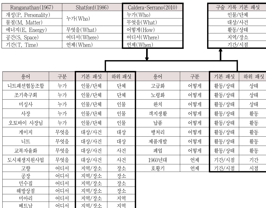
<그림 1> 구술 기록 주제명표목을 위한 패킷 설정

먼저, 추출된 용어들을 육하원칙에 따른 패킷, ‘누가, 무엇을, 어떻게, 어디서, 언제’로 구분한 뒤 각 패킷 별로 용어들을 확인하였다. 다음으로 구술 내용과 용어의 성격을 명확하게 표현할 수 있는 패킷명을 설정하였다. 이렇게 육하원칙의 패킷에 대응해서 설정된 기본 패킷은 ‘인물/단체’, ‘대상/사건’, ‘활동/상태’, ‘지역/장소’, ‘기간/시점’이다.