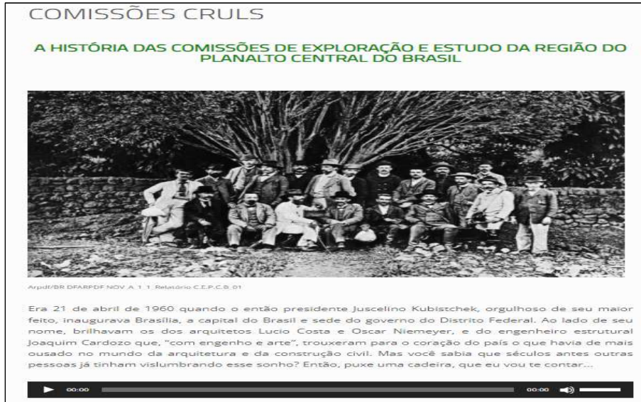
〈그림 5〉 브라질 중부고원 탐사연구위원회의 역사 가상 전시화면

가상전시는 각 테마별로 주제와 관련된 사진, 영상 등 시청각 기록물 위주로 기획되었다. 5개의 주제별로 전시하고 있는 기록물에 대한 간략한 정보가 텍스트와 음성파일로 제공되고 있다. ArPDF 웹사이트에서 전시회 링크를 클릭하면 해당 전시를 즉시 관람할 수 있다. <그림 5>는 브라질 중부고원 탐사연구위원회의 역사와 관련된 가상 전시화면의 일부로 사진 기록물을 활용하여 그에 대한 배경 설명이 텍스트로 제공되고 있으며, 하단의 재생버튼을 클릭하면 해당내용의 음성파일이 재생된다.