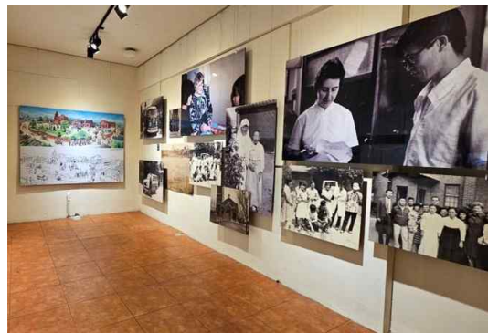
[좌] ‘메리놀병원’이 소멸된 장소의 거리전시 모습. 장소를 기록물, 장소가 위치한 주민들의 일상공간을 아카이브로 구조화하였다. 장소에는 이름, 설립일, 유형, 소재지, 개요 등의 메타데이터가 라벨링 되었고, 장소의 가치와 의미를 설명하는 주민의 인터뷰 글이 곁들여 졌다.