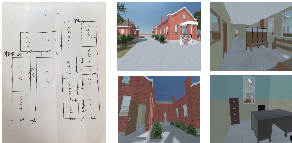
<그림 3> 주민 정기선이 그린 '증평 메리놀병원' 내부구조와 메타버스로 복원된 모습