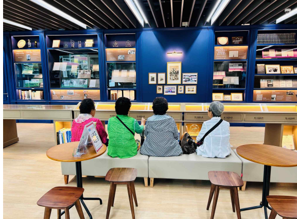
[좌]중평 메리놀병원 개원 당시 근무했던 요안나 수녀가 그림기록을 살펴보며 기억을 되살리고 있다. [우]주민들이 <중평, 기록의 정원> 전시를 관람하며 메리놀병원에 대한 각자의 경험과 기억을 나누고 있다.