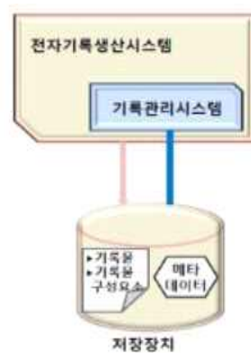
<그림 3> 전자기록생산시스템(업무관리시스템)과 기록관리시스템이 통합된 형태

위와 같은 문제를 개선하기 위해 다음과 같은 방안을 제안하고자 한다. 업무 진행과 동시에 기록을 생산, 분류, 보존, 폐기까지 통합적으로 관리할 수 있는 표준화된 전자기록생산시스템을 도입하는 것이다. 구체적으로 국내 업무시스템의 기록관리지침 및 기능요건 표준 『KS X ISO 16175-3』 및 전자기록생산시스템 기록관리 기능요건 표준 『NAK 19-1:2012(v1.0)』의 기록관리 기능요건을 반영하여 ‘전자기록생산시스템과 기록관리시스템이 통합된 형태’의 시스템을 설계하고 적용하는 방안을 제안하고자 한다. 이는 별도의 기록관리시스템으로 기록을 이관하지 않고, 업무 진행과 동시에 기록을 생산, 분류, 보존, 폐기까지 통합적으로 관리할 수 있는 구조로 <그림 3>과 같이 나타낼 수 있다.