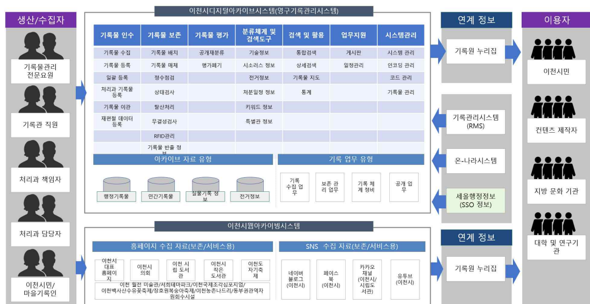
〈그림 5〉 이천기록유산시스템 체계도

결과적으로 디지털아카이브시스템은 2019년 구축 사업(사업비 296,010천 원)과 2021년 고도화 사업(사업비 392,000천 원)을 거쳐 완성도를 높였다. 아울러 2020년에는 웹 아카이빙 시스템(사업비 114,727천 원)과 누리집(사업비 145,841천 원) 구축을 완료함으로써 현재의 포괄적이고 입체적인 이천기록유산시스템의 진용을 갖추게 되었다.