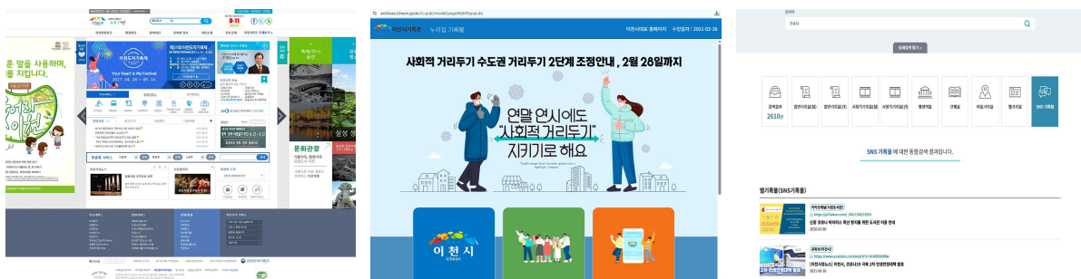
〈그림 4〉 이천시 대표 누리집 웹기록물

이러한 디지털 기록의 소멸을 방지하고자, 2017년부터 이천시에서 운영하는 약 50개의 누리집을 대상으로 스냅샷(Snapshot) 방식의 웹 아카이빙을 시작하였다(이천시, 2017b). 나아가 2020년 이천시 자체 웹아카이빙시스템을 구축한 이후에는 수집 대상을 소셜 네트워크 서비스(SNS) 영역까지 확장하였다. 그 결과 전국 기록물관리기관 중 최초로 누리집과 SNS 웹 기록물 서비스를 동시에 제공(이천시립기록원 누리집, https://archives.icheon.go.kr )하는 유의미한 성과를 거두었다.