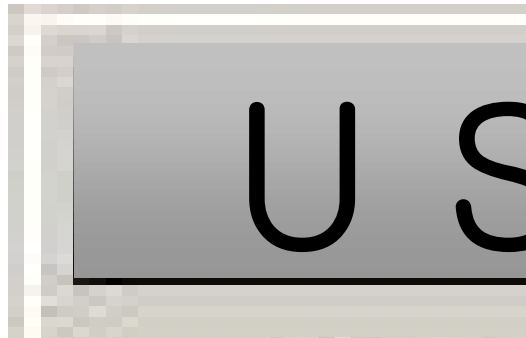
그림 4. 사용자 마스터 필드 매핑 fig 4. User Master Field Mapping

그림에서 보는 바와 같이 주문에 관련된 필드들과 해당 요소간의 매핑이 가능하도록 제공한다. 그리고(그림 4)는 사용자 마스터 필드에 대한 매핑 모습을 보여준다.