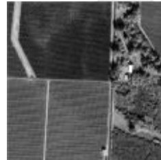
그림 7. 워터마크가 삽입된 샘플 2 Fig. 7. watermark embedded sample-2