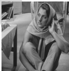
그림 6. 워터마크가 삽입된 샘플 1 Fig. 6. watermark embedded sample-1

(그림 6)과 (그림 7)은 제안한 알고리즘을 사용하여 워터마크가 삽입된 영상이다. 시각적으로 워터마크의 삽입 여부를 구분하기 어렵다. 워터마크를 삽입 후 원영상의 화질 왜곡의 정도를 측정하기 위하여 PSNR을 계산하였다. 표 1~3에서 알 수 있듯이 제안된 방법이 DCT나 웨이블릿 기반의 워터마킹 기법에 비해 좀더 높은 성능을 보이는 것을 알 수 있다.