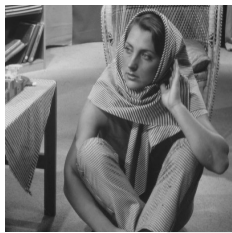
그림 3. 샘플 1 Fig. 3. Sample-1

제안된 기법의 성능을 평가하기 위하여 비교적 고주파 성분이 많이 포함된 512×512 크기의 영상 두 개를 이용하였다. (그림 3)은 영상처리에 많이 이용되는 'babara' 영상이고, (그림 4)는 높은 고도에서 찍은 사진이다. 특히 (그림 4)는 기하학적인 모양이 반복되어 인물 등의 일반적인 영상에 비해 고주파 성분이 많이 포함되어 있다. (그림 5)는 워터마크로 사용된 2D 바코드 영상이다. 이 바코드 영상은 IP, 로그인 사용자, 네트워크 상의 다운로드 시간 등 디지털 콘텐츠의 저작권을 나타내는 정보를 포함하고 있다.