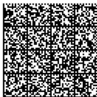
그림 5. 워터마크로 이용된 2D 바코드 Fig. 5. 2D barcode Image for Watermark

웨이블릿 패킷 변환에는 9-7 탭 biorthogonal 웨이블릿 필터와 1차 엔트로피 기준을 이용하였다.