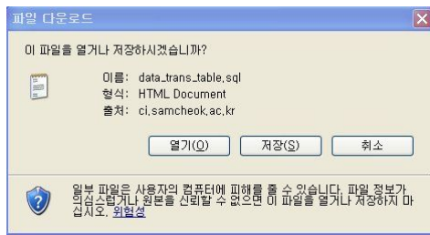
그림 3. Data 타입 저장 화면 Fig 3. Display of Data type backup

Data 타입은 해당 테이블 구조를 정의하는 SQL 문과 순수 데이터를 삽입하는 SQL문을 구성된 자료를 백업한다. 이 타입은 자료 저장 서버에 문제가 발생할 경우 MySQL과 같은 DBMS를 재설치한 후 쿼리문을 수행함으로써 쉽게 자료를 복구할 수 있다. (그림2)의 자료 관리 화면에서 사각형으로 표시한 테이블을 클릭하면 (그림3)과 같이 해당 테이블에 저장된 순수 데이터와 테이블 구조가 함께 *.sql 형식의 파일로 원격지에 전송된다.