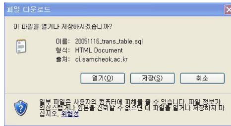
그림 5. SQL 타입 저장 화면 Fig 5. Display of SQL type backup

이 방식은 Data 방식에 비해 해당 테이블 구조만을 백업함으로써 백업 자료 크기의 축소와 신속한 업로드가 가능하다. (그림2)의 자료 관리 화면에서 원형으로 표시한 SQL 버튼을 클릭하면 (그림5)와 같이 해당 테이블에 저장된 테이블 구조가 "저장일+테이블 명.sql" 형식의 파일로 원격지에 전송된다.