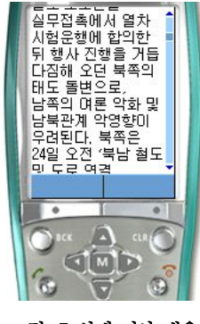
그림. 5 실제 기사 내용 Fig. 5 Real news contents