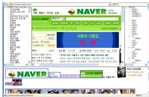
그림 3 링크 노드 추출 Fig. 3 Extract a linked node

(그림 2)는 제안 방법의 기본 흐름을 나타낸다. 일반 웹 페이지의 경우 웰폼드 형식이 아니기 때문에 웰폼한 XML 파일로 생성을 위해 현재 웹 페이지의 전체 구조를 파싱해서 트리형태로 구성한다. 이때 비구조적 HTML을 완벽하게 구조적으로 생성하는 것은 문제가 있기 때문에 중요노드에 대한 정보를 추출한다. 본 논문에서 중요노드라고 판단하는 기준은 다음페이지로의 링크의 유무를 이용해 판단한다. 대부분의 사이트의 경우 섹션별로 콘텐츠를 구성하고 있으며 이를 메인 페이지라고 할 경우메인 페이지는 요약해 제공하고 연결된 하위 페이지는 메인 페이지의 상세 정보를 담고 있다. 즉, 하위 페이지로의 링크를 갖는 텍스트나 이미지의 경우 하위 페이지에 상세한 정보를 더 포함하고 있기 때문에 메인 페이지에서 다른 부분에 비해서 중요한 내용을 포함한다고 볼 수 있다. 따라서 (그림 3)에서와 같이 현재 페이지에서의 링크가 걸린 텍스트와 이미지 요소를 추출한다. 오른쪽 창은 현재 페이지의 노드 트리를 보여주고 있다.