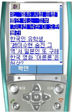
그림. 4 뉴스 기사 선택 Fig. 4 News index page