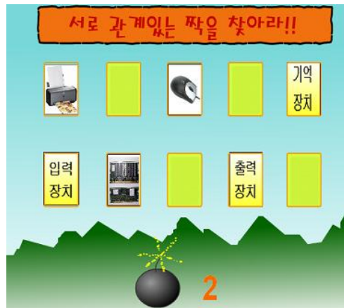
그림 2. 게임화면 Fig. 2. Screen of game