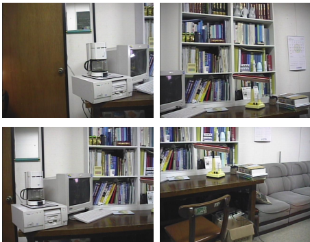
그림 1. 임의의 입력 영상 1 Fig 1. Samples of Input Image 1

〈그림 1〉은 모든 프레임들 중에서 임의의 4개의 영상만을 선택하여 나타내 준 것이다.