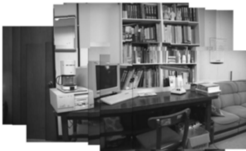
그림 2. 파노라믹 영상 Fig 2. Panoramic Image

〈그림 2〉는 〈그림 1〉의 영상들을 입력받은 동영상 비디오로부터 고정된 참조에 의해 생성되어진 파노라믹 영상이다. 파노라믹 영상을 보면 상하좌,우가 상당히 길어진 것을 알 수 있으며, 이런 파노라믹 영상을 통해서 전체적인 비디오의 내용을 이해할 수 있다.