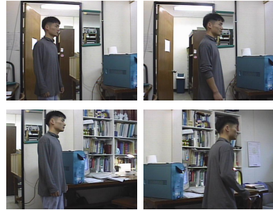
그림 3. 임의의 입력 영상 2 Fig 3. Samples of Input Image 2

〈그림 4〉는 〈그림 3〉의 입력 영상에서 고정된 참조로서, 배경 영상만을 파노라믹 영상으로 구축한 것이고, 〈그림 5〉는 시간에 따라 변하는 참조로서, 동적 객체를 일정한 시간 별로 표현해 준 파노라믹 영상으로 구축되어진 영상이다.