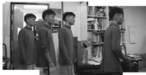
그림 5. 전체적인 파노라믹 영상 Fig 5. Wholly Panoramic Image

학교에서 캡처한 30초짜리 비디오 5개를 파노라믹 영상으로 구축한 결과는 〈표 1〉과 같다.