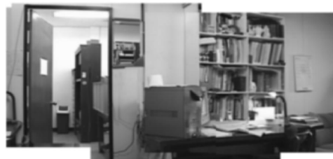
그림 4. 배경의 파노라믹 영상 Fig 4. Background Panoramic Image

〈그림 4〉는 〈그림 3〉의 입력 영상에서 고정된 참조로서, 배경 영상만을 파노라믹 영상으로 구축한 것이고, 〈그림 5〉는 시간에 따라 변하는 참조로서, 동적 객체를 일정한 시간 별로 표현해 준 파노라믹 영상으로 구축되어진 영상이다.