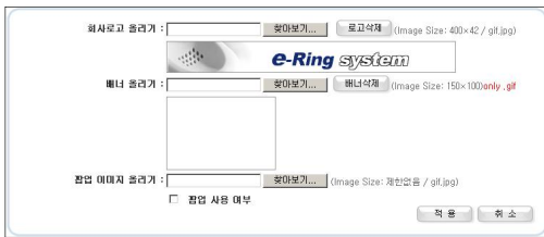
그림 8. 로고, 팝업 Fig. 8. Logo, pop-up

위의 기능 중 웹 사이트 관리는 회사 로고 변경, 배너등록과 팝업 등록을 할 수 있다. 뿐만 아니라 관리자의 패스워드와 이메일 주소를 변경할 수 있고 내선 사용자들의 정보를 .csv 파일로 일괄 등록할 수 있으며 반대로 e-Ring 시스템에 가입되어 있는 사용자 정보를 .csv 파일로 다운로드 받을 수 있다. 다음 그림 8은 회사로고, 배너, 팝업 이미지를 바꿀 수 있는 화면이다.