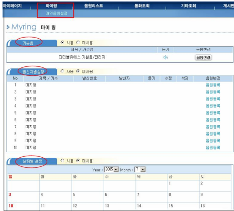
그림 5. 마이링 Fig. 5. My ring

그리고 사용자 자신에게 걸려온 통화 내역을 확인할 수 가 있으며, 통화 정보는 통화중, 부재중, 수신의 형태로 구 분되어 나타난다. 통화중은 사용자가 통화중일 때, 걸려온 전화를 나타내며, 부재중은 사용자 개인이 전화를 받지 못 한 모든 전화를 표시하고, 수신은 사용자와 발신자의 통화 가 이루어진 상태를 나타낸다. 특히 통화내역 조회시, 날짜, 통화정보, 발신번호에 따라 찾기가 가능하고, 조회된 통화내 역은 텍스트, 인쇄 및 엑셀등의 형태로 보관할 수 있다. 다 음 그림 6은 통화내역을 조회한 결과이다.