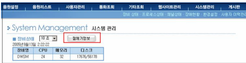
그림 9. 장비 상태 Fig. 9. System status

시스템 관리 기능은 시스템의 장비상태, 프로세스 상태, 채널 상태, 장애 현황 및 환경 설정 등을 확인할 수 있다. 먼저 장비상태는 장비명과 cpu 사용량, 메모리 사용량, 디스크 사용량 및 절체기 정보를 확인할 수 있으며, 절체기 상태를 OFF로 변경시키면 통화연결음 서비스를 사용할 수 없다. 아래의 그림 9는 장비상태를 보여주고 있다.