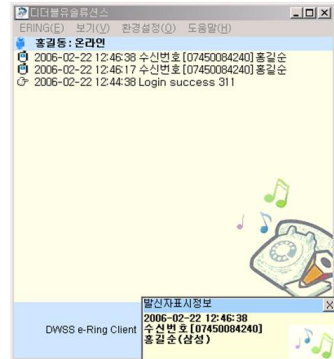
그림 10. 클라이언트 Fig. 10. Client

마지막으로 e-Ring 클라이언트는 e-Ring Client.Zip의 압축을 풀고 Setup.exe를 실행하면 된다. 설치가 완료되고 나면 바탕화면에 e-Ring Client 아이콘이 생성되며, 아이콘을 클릭하여 e-Ring Client를 사용하면 된다. 먼저 '환경 설정' 버튼을 클릭하여 '연결'에 e-Ring 시스템의 서버주소와 웹 주소를 입력하고 '표시' 항목에서 '소리없음'을 선택하면 발신자 번호 표시를 나타낼 때, 링소리가 들리지 않는다. 그리고 마지막으로 '기타 설정' 항목에서 폼 시작 위치를 5가지 중앙, 오른쪽 하단, 오른쪽 상단, 왼쪽 하단과 왼쪽 상단 중 하나를 선택해서 설정해 주면 설정한 위치에 e-Ring Client가 나타나게 된다. 그림 10은 클라이언트 실행화면을 보여주고 있다.