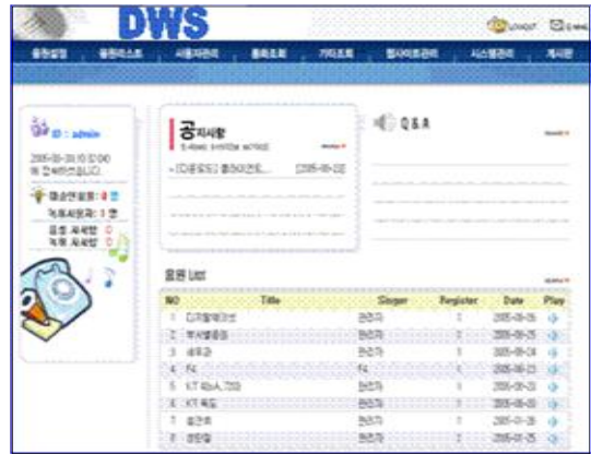
그림 4. 메인 화면 Fig. 4. Main display

일반인으로 로그인이 성공하면, 다음 그림 4처럼 메인 화면이 나타나며, 메인 화면의 좌측 중앙에서 자신의 권한을 확인할 수 있다. 개인 사용자로서 e-Ring 서비스를 사용할 수 있는 통화연결음 권한은 '일반 사용자' 권한과 '일반 + 음원설정 + 음원업로드' 권한 중 하나를 갖게 된다. 음원 업로드 X, 음원 설정 X인 경우가 일반 사용자 권한을 나타내며, 음원 업로드 O, 음원 설정 O 인 경우가 일반+음원설정+음원 업로드 권한을 가진 사용자를 나타낸다. 아래의 그림 4는 e-Ring 시스템의 메인화면이다.