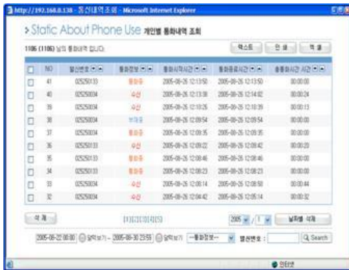
그림 6. 통화내역 결과 Fig. 6. Results of the phone use

그리고 사용자 자신에게 걸려온 통화 내역을 확인할 수 가 있으며, 통화 정보는 통화중, 부재중, 수신의 형태로 구 분되어 나타난다. 통화중은 사용자가 통화중일 때, 걸려온 전화를 나타내며, 부재중은 사용자 개인이 전화를 받지 못 한 모든 전화를 표시하고, 수신은 사용자와 발신자의 통화 가 이루어진 상태를 나타낸다. 특히 통화내역 조회시, 날짜, 통화정보, 발신번호에 따라 찾기가 가능하고, 조회된 통화내 역은 텍스트, 인쇄 및 엑셀등의 형태로 보관할 수 있다. 다 음 그림 6은 통화내역을 조회한 결과이다.