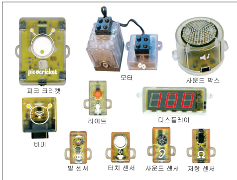
그림 1. 피코 크리켓 구성요소 Fig. 1. Pico Cricket Component

피코 크리켓의 구성요소로 컴퓨터의 본체에 해당하는 “피코 크리켓”, 컴퓨터에서 프로그래밍 한 데이터를 전송시켜주는 “비머”, 프로그래밍 한 결과를 출력하는 데 사용되는 출력 장치들인, “사운드 박스”, “디스플레이”, “모터”, “라이트”, 주변의 환경을 감지하는 센서들인, “사운드 센서”, “빛센서”, “터치센서”, “저항센서” 등이 있다.