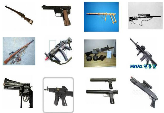
그림 1. 쿼리 결과 1 Fig. 1. Query Result 1

아래의 그림 1은 총을 질의어로 주었을 경우 검색 결과로서 나온 그림들을 나타낸다. 맨 첫 번째 그림은 질의로 준 총을 나타낸다.