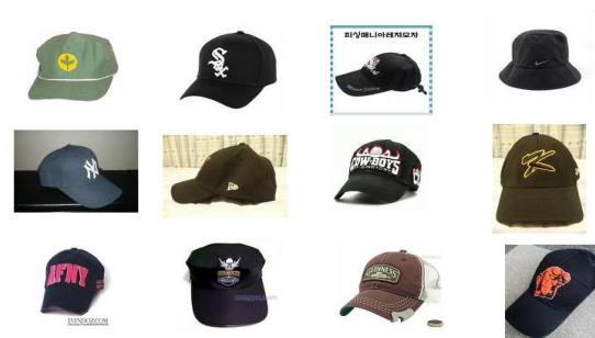
그림 2. 쿼리 결과 2 Fig. 2. Query Result 2

아래의 그림2는 모자를 질의어로 주었을 경우의 검색 결과를 나타낸다. 역시 첫 번째 모자 영상은 질의로 준 모자를 나타낸다.