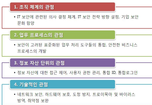
그림 2. 일반적인 정보 보안 정책 적용 절차 Fig. 2. General Information Security Policy Adoption Steps