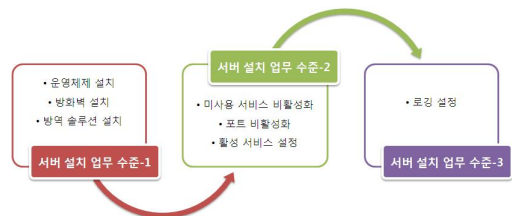
그림 4. 수준별 서버 설치 업무 프로세스 목록 Fig. 4. Server installation processes by Levels

사용 기간 동안에 필요한 보안 관련 사항 및 신뢰성 측면을 분석하기 위해서는 관리자, 사용자, 서비스 제공업체, 기반 시스템, 및 인가되지 않은 외부 사용자 등이 분석의 대상으로 고려되어야 한다.