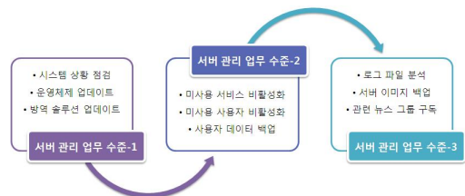
그림 5. 수준별 서버 관리 업무 프로세스 목록 Fig. 5. Server maintenance processes by Levels