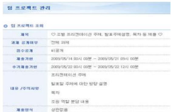
그림 8. 팀 프로젝트 관리 Fig 8. Team project management

중간고사 이후에는 팀별 구성을 하고 팀별 프로젝트를 선정하여 팀 단위 학습을 통해 개인학습으로 작은 단위의 프로그램만 접하던 것을 좀 더 폭 넓게 큰 단위의 프로그램을 경험할 수 있는 응용프로그램을 통해 프로젝트 수행을 할 수 있도록 구성한다.