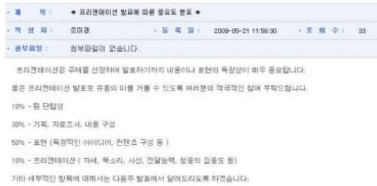
그림 10. 프리젠테이션 발표 평가 항목 제시 Fig 10. Evaluation item for presentation

기능으로 메일보다 신속한 질의 응대를 할 수 있는 장점도 있다. 대체로 팀 프로젝트 발표 후에는 완성된 프로그램에 대해 본인 스스로 참여하여 해결하였다는 성취감을 갖게 되고 보다 향상된 고급기술에 대한 도전 의식과 가능성에 대한 기대감을 갖게 할 수 있다.