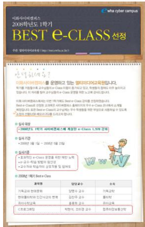
그림 13. 사이버캠퍼스를 통한 우수강의선정 Fig 13. Selected Best e-Class

[그림12]은 프로그래밍 교과는 아니지만 반드시 실습을 중심으로 하는 교과로서 "컴퓨터의응용" 과목에서 본 연구에서 소개한 동일한 방식의 루브릭을 적용해 학기 수업을 마치며 "E" 대학교가 학생들을 대상으로 교과학습에 대한 만족도를 실시한 결과이다. 이때 5점 만점에서 4.5이상을 받은 교수는 대학교 교무처 주관의 우수강의 교수로 수상을 할 수 있다. 일반적인 통계로는 인문계열 교수들이 우수강의 교수로 대체로 선정되는 실정이나 루브릭을 적용한 교과학습 실시 이후에는 공학계열에서도 우수강의 평점에 도달하여 과거 강의평가가 저조하게 나타났던 프로그래밍 교과에서도 학생들이 수업에 대한 만족도를 보여 주고 있다. "E" 대학교 멀티미디어 교육원에서는 온라인을 평가도구로 사용하여 매학기 2천여개가 동시에 진행되는 강좌를 평가하여 그 중 3~4명의 교수를 우수강좌로 선정하고 홈페이지에 게시한다. 우수교수들의 수업 진행 방식을 교수와 학생들을 대상으로 홍보하며 홈페이지에 자료를 올려 놓는다. 이때 교수나 학생이 공유하며 서로 도입할 수 있도록 권면하고 있다. 본 연구에서 사례로 설명하고 있는 "C프로그래밍실습" 과목이 우수강좌로 선정되었던 사례를 [그림13]에서 보여 주고 있다.