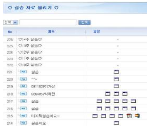
그림 5. 주차별 실습과제 게시판 Fig 5. A task board (per week)

교과수업 개설전 사이버캠퍼스를 통해 강의계획서와 강의에 사용될 주교재, 부교재를 소개한다. 교과수업 개강 일에는 한 학기 동안의 수업 운영방식 설명과 학생들의 수준을 평가한다. 설명의 주요사항으로는 다음과 같다. 교수는 각 단원에 핵심 알고리즘을 설명하고 이에 맞는 프로그램 코딩을 직접 입력해 가며 학생들과 동시에 빔 프로젝트를 통해 결과를 실행한다. 여기서 문제점들을 교수와 학생이 1:1 방식으로 학생 프로그램의 버그 또는 문제점을 교수는 지원한다.