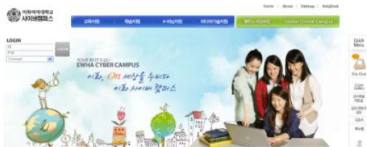
그림 3 “E” 대학교 사이버캠퍼스 Fig 3. “E” University cyber campus

서울에 소재한 “E” 대학교의 경우 전공기초로 운영하고 있는 “C프로그래밍실습” 과목은 7개 분반으로 운영되고 있으며 대부분 시간강사들이 수업을 진행하고 있다. 학생들이 프로그래밍 수업이수 후에도 프로그래밍 코딩조차 할 수 없는 이유를 분석하여 두 가지의 문제점을 제안 한다. 첫째는 프로그래밍 실습과목임에도 불구하고 교수가 이론위주의 수업을 진행하거나 중간고사와 학기말고사 시험을 필기형식으로 진행한다는 것이 큰 문제였다. 둘째 시간강사 섭외시 실습수업 진행 능력이 부족하거나 알고리즘의 명확한 이해능력이 부족한 강사를 섭외했을 때 학생들이 체계적이고 질 높은 강의를 수강할 수 없다는 것이었다. 이에 “C프로그래밍실습” 과목에 루브릭을 적용한 사례를 통해 수업을 수강하는 학생자 입장에서 향상된 학습효과가 나타나는지를 살펴 보자.