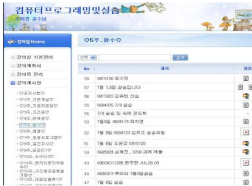
그림 6. 주차별 실습프로그램 게시판 Fig 6. Practical exercise board (perweek)

례에 따라 해당되는 팀이 10분 이내로 지난시간에 학습을 통해 과제실습 게시판에 업로드한 스스로의 프로그램을 모든 학생들 앞에서 프리젠테이션을 통해 문제와 해결 핵심 알고리즘 그리고 결과 등을 발표하게 한다. 이러한 과정은 교수만이 수업의 주체가 아니라 학생 스스로가 발표 준비 등을 통해 수업의 주체임을 강하게 느낄 수 있으며 발표를 듣는 학생의 입장에서 자연스럽게 지난 학습을 반복하며 상기하고 금일 진행될 수업의 학습내용과 연관성을 연결하는 통로 역할을 할 수 있다. 발표를 마치면 교수는 발표의 핵심을 간략하게 다시 한번 상기 시키고 단점과 장점 또는 확장성에 대한 제안도 제시해 준다. 실습과제 게시판에 올라온 문제 중 모두 좋다고 느끼게 하는 문제를 제시한 알고리즘은 일부 채택하여 교수가 시험에 반영하겠다고 학기 초에 공지사항으로 알린다.