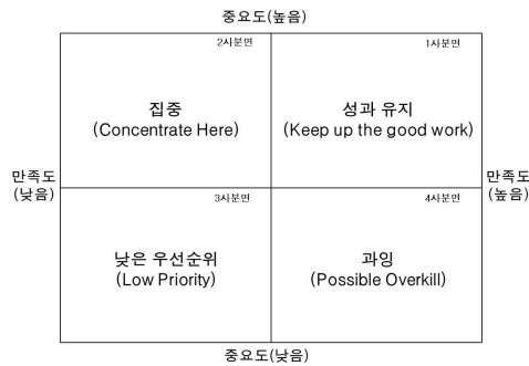
그림 1 IPA 모형 Fig 1. IPA model

IPA는 Martilla & James에 의해 처음 소개된 방법으로 상품이나 서비스에 대한 사용자의 만족을 측정하기 위해 각 속성의 이용 전 중요도와 이용 후 만족도를 평가하여 각 속성의 상대적 중요도와 성취도를 동시에 비교 분석하는 평가기법이다.