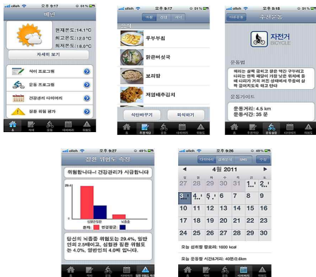
그림3 . 스마트 헬스케어 어플리케이션 UI Fig 3. Smart Healthcare application UI

개인 맞춤형 스마트 헬스케어 서비스 제공하기 위한 ios기반의 어플리케이션 개발하였다. 본 서비스는 환자의 건강정보를 처방전달시스템(OCS)연동을 통해 입력란을 최소화하여 정보획득의 정확성을 높였다. 또한 다이어리 서비스를 활용하여 의료진에게 환자의 건강상태를 보다 정확하게 진단하고 치료하도록 도움을 줄 수 있다.