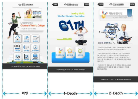
그림 12. 파트별 HTML 실행화면 Fig. 12. A part HTML execution screen