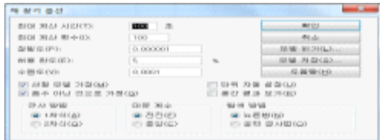
그림 10. 해 찾기 옵션 Fig 10. Solver Options

본 연구의 Model에서는 평가 결과점수와 요구 점가 같으면서 예산이 회계연도 전체 예산액보다 평가 개선에 투입되는 실제 총 예산액이 적게 산출되었다. 따라서 당해 연도 예산보다 높게 책정되어 10,094,023천원의 예산이 더 소요되었다. <표 9> A 대학 2010년도 평가지표 별 평가 결과의 평가 결과 항목에 대한 각각의 예산은 본 연구에서 제시된 예산 배분 모델을 이용하여 Spread sheet의 모형으로 적용하여 예산분배의 적절한 방법을 얻을 수 있다.