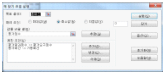
그림 9. 해 찾기 모델 설정 Fig 9. Solver model set