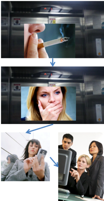
그림 1, 흡연 불쾌감을 느껴서 신고 Fig. 1 Declare Feeling of Discomfort on Smoking

보통 엘리베이터 내에서 흡연을 한 후 약 30분 정도는 담배 연기와 냄새에 엘리베이터를 타는 다른 사람들이 불쾌감을 느끼곤 한다. 따라서 검색은 그러한 불쾌감을 느껴서 관리실에 신고한 시간을 기준으로 30분 이전의 비디오로부터 검색하도록 한다. 그림 1은 불쾌감을 느껴서 신고를 하는 경우를 나타낸 것이다.