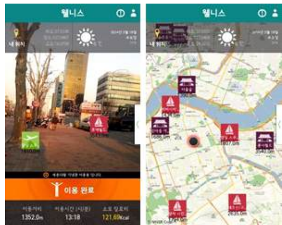
그림 1. 구현된 추천 시스템의 모바일 단말 상의 실행 화면 Fig. 1. Screen Shot of Implemented Recommendation System in Mobile Device

실험을 위해 구현된 추천 시스템은 모바일 환경에서 사용자들에게 증강현실 기반의 문화재, 레저, 관광지 콘텐츠를 증강현실로 제공하기 위해 구축되었다. 구현된 추천 시스템의 모바일 단말 상에서의 실행 화면은 그림 1과 같다. 이 두 화면은 각각 증강현실 형태와 지도 형태의 인터페이스를 통해 사용자에게 아이템을 제공하는 화면이다.