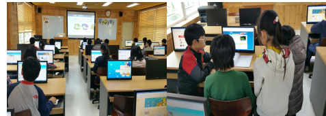
그림 4. 학습모형을 적용한 수업모습 Fig. 4. Lesson scene of learning model

(그림 4)는 학습자들이 실제 수업에서 스마트 기반 협력학습 모형을 적용하여 활동하는 장면이다.