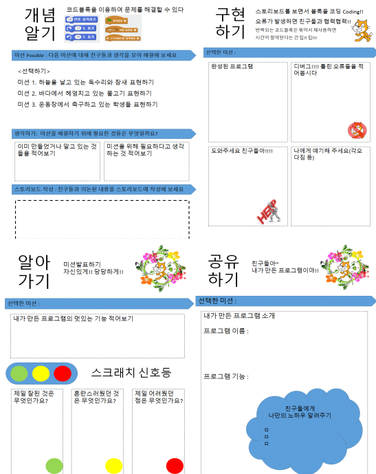
그림 3. 학습단계별 워크북(예시) Fig. 3. The Workbook of learning phase(example)

알아가기 단계의 교재내용은 구현하기를 통해 경험한 프로그래밍의 과정을 상기하고 내면화할 수 있는 영역으로 구성하였다. 특히 '스크래치 신호등' 영역은 학습자가 프로그래밍 개념을 이해하고 내면화하기 위해 필요한 자기 질문과 점검 내용을 색깔별로 구분하여 적을 수 있는 영역이다. 이를 통해 초보 학습자들의 경우 보다 쉽게 핵심을 파악하고, 노랑과 빨강색에 적은 자신의 문제해결의 어려운 점을 다른 학습자들과 공유하여 지원받을 수 있다.