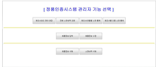
그림 9. 정품 인증 시스템 관리자 웹 페이지

정품 인증 어플리케이션에서 전송되는 조회 데이터들을 저장하고 관리하기 위한 서버 시스템은 http://www.qrjin.com 을 통해 서비스되고 있다.