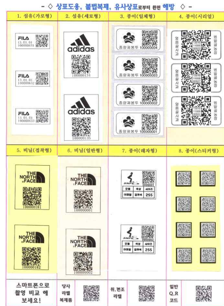
그림 6. 정품 인증 QR 코드 샘플 Fig. 6. QR code samples for genuine authentication

정품 인증 과정에서 사용자는 스마트폰에 어플리케이션을 설치하고 스마트폰의 카메라로 상품의 QR 코드를 촬영함으로써 정품 인증을 진행할 수 있으므로 사용자는 추가 장비 없이 간편하게 정품 여부를 확인할 수 있다. 개발된 어플리케이션은 1차적으로 QR 코드 내의 제조사/상품 정보와 인증 정보를 사용하여 정품 여부를 판단한다. 1단계 인증을 통과하는 경우 어플리케이션에서는 위치 정보와 함께 제조사/상품 정보를 서버 시스템으로 전송한다. 또한 어플리케이션은 서버 시스템에서의 인증 결과를 호출하는 역할도 수행한다. 그림 7은 정품 인증용 어플리케이션의 캡처 화면으로 인증이 진행되는 과정을 나타낸 것이다.