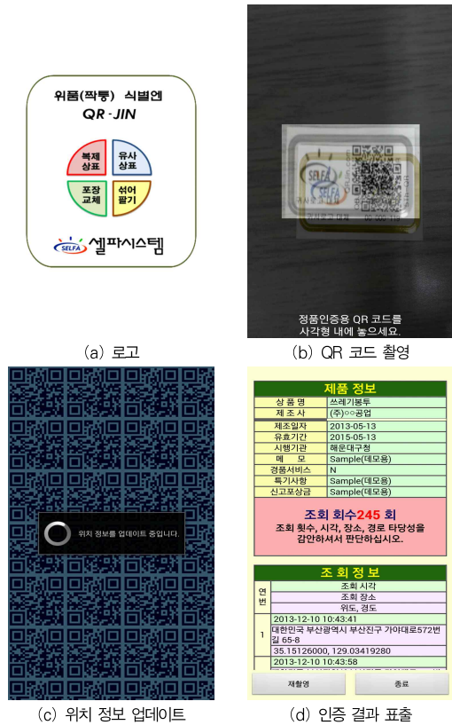
그림 7. 정품 인증 어플리케이션 실행 화면