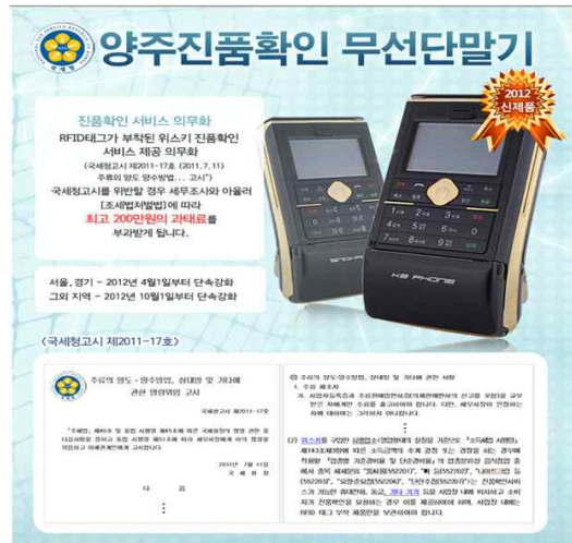
그림 2. 양주 진품 확인용 단말기 (신신엠앤씨) Fig. 2. Genuine authentication terminal for liquors (SINSIN M&C)

국세청에서 도입한 RFID를 기초로 한 방식으로 상품 내 RFID를 삽입해야 하고 전용 단말기가 없으면 조회가 불가능한 등 비용 증가 이외에도 운용상의 한계점이 존재한다. 특히 소비자가 직접 조회하기 어렵다는 한계로 정품 인증의 기본 취지와는 다소 거리가 있으며 다른 상품에 적용하기 위해서는 생산 시설의 많은 부분을 개편해야 하는 등 생산자 측면에서도 도입하기 어려운 방법이다.