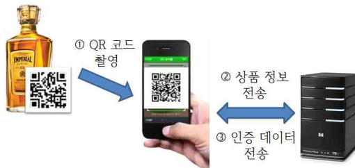
그림 4. 정품 인증 프레임워크 Fig. 4. Genuine authentication framework

정품 인증 프레임워크는 그림 4와 같이 디자인 QR 코드, 정품 인증용 어플리케이션, 그리고 서버 시스템의 3 부분으로 구성된다.