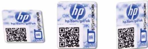
그림 3. 정품인증용 위조 방지 라벨 (HP) Fig. 3. Anti-counterfeit label for genuine authentication (HP)

있다. 하지만 HP에서 대상으로 하는 제품은 일회성 소모품에 한하며 등록된 제품 코드와 스캔된 코드를 비교하여 인증하는 수준에 그치고 있다.