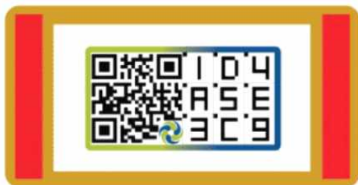
그림 1. 정품 인증용 변형 QR 코드 (한국정품인증원) Fig. 1. Modified QR code for genuine product authentication (Korea genuiness authentication Organization)

한국정품인증원의 RDTAG는 특수 용지에 인쇄된 QR 코드 형식을 가진다. 상품은 QR 코드에 보안용 스티커를 부착하여 출고되며 정품을 확인하기 위해서는 이를 제거하고 촬영한다. 하지만 RDTAG는 이중으로 구성된 변형 QR 코드 형식을 가지고 있어 그 크기가 커 모든 상품에 적용하기는 어려우며 특수 용지에 인쇄하므로 상품의 재질에 따라 부착하기 어려운 점이 있다. 또한 보안용 스티커를 제거한 경우에는 인증 효과가 반감되므로 소비성 제품에만 적용될 수 있는 한계가 있는 등 전체적으로 비용이 증가하는 단점이 있다.