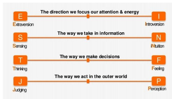
Fig. 1. The 4 types of MBTI Preference

MBTI의 4쌍의 선호 유형을 자세히 살펴보면 다음과 같다. 첫 번째로 외향성(Extraversion)과 내향성(Introversion)이다. E-I지표는 개인이 외부 세계 혹은 내부 세계 중 어느 세계에서 더 에너지를 얻는 방향에 초점을 맞추고 있다. 외향을 선호하는 사람들은 그들이 다른 사람들과 있을 때 활력이 넘친다. 반면 내향을 선호하는 사람들은 주로 혼자 내부에서 에너지를 얻는다. 두 번째 쌍의 선호 유형은 감각형(Sensing)과 직관형(Intuition)이다. S-N지표는 정보 수집, 인식 유형이다. 감각은 현실의 세계 즉, 감각에 의해 체험할 수 있는 경험사실에 초점을 맞추고 있다. 그리고 직관은 미래에 있을 가능성이 있는 미래지향세계에 초점을 맞춘다. 세 번째 쌍은 사고형(Thinking)과 감정형(Feeling)이다. T-F지표는 우리가 판단을 내리는 과정과 관계가 있다. 두 선호 모두 합리적이다. 이 두 유형간의 주요한 차이점은 사고형은 판단을 내릴 때 객관적인 척도에 기준을 두고 판단한다는 것이고, 반면 감정형은 개인적인 가치에 기준을 두고 판단을 한다는 점이다. 네 번째는 판단형(Judging)과 인식형(Perception)이다. J-P지표는 외부세계를 받아들이는 태도 유형이다. 판단을 선호하는 사람들은 외부 세계에 대해 판단을 하거나 결론에 이르는 것이 익숙하다. 반면 인식을 선호하는 사람들은 지속적으로 상황을 살피고, 이에 적응하려는 데 초점을 둔다. MBTI의 4쌍의 선호 유형과 이를 조합한 성격 유형 16가지를 정리하면 [그림1][그림2]와 같다.