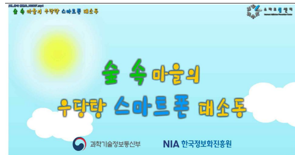
Fig. 2. 2018' Smartphone overdependence prevention education contents.

한편, 앞서 언급한 바와 같이 ‘국가정보화기본법’ 일부개정령으로 어린이집과 유치원의 교사·유아를 대상 예방교육 및 바른 사용교육 등을 강화하는 정책이 시행되고 있으며 전국의 스마트쉼센터 등을 중심으로 기관 방문교육과 문화체험공연(인형극)이 이루어지고 있다. 그러나 사업량이나 수행이 매우 부족한 실정이며 특히 어린이집 방문교육에 사용되는 교수매체가 아래 <그림 2>, <그림 3>과 같이 애니메이션 동영상 중심의 콘텐츠로 구성되어 있다는 점은 교육의 취지와 어긋나 있어 교육콘텐츠의 매체수정이 요구된다.