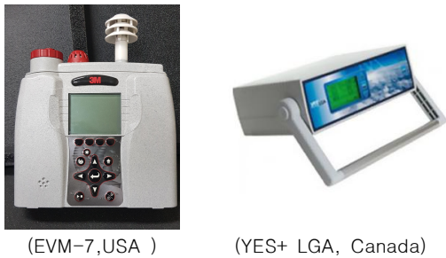
Fig. 1. Measuring equipment

설문조사의 경우 요양병원 근무자의 실내공기질 및 실내환경 요소의 만족정도, 실내공기질 관리현황 등에 대하여 조사하고 실내공기질 만족 정도에 따른 실내환경요소 및 실내공기질 관리방안을 분석하기 위하여 표준화된 자기기입식 설문지 (self-administered questionnaire)를 사용하여 조사를 실시하였으며 69명을 대상으로 연구를 실시하였다.